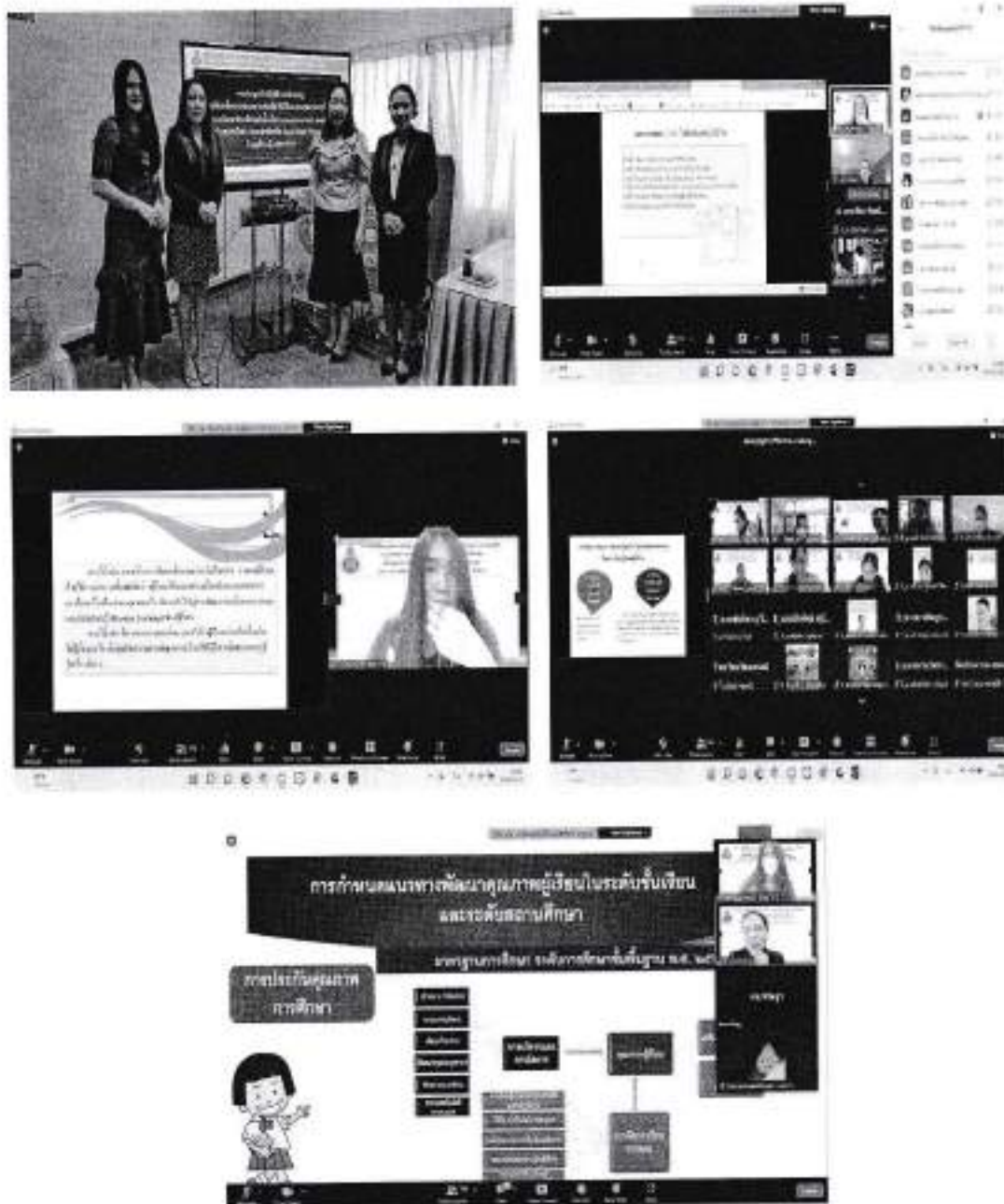
ภาพประกอบ

ปรับเปลี่ยนการจัดประชุมเชิงปฏิบัติการจากที่วางแผนไว้เป็นรูปแบบ face to face ปรับเปลี่ยนเป็นการประชุมเชิงปฏิบัติการในรูปแบบออนไลน์ ผ่านแอปพลิเคชัน Zoom Cloud Meetings พร้อมทั้งนิเทศ ติดตามในรูปแบบทางไกล