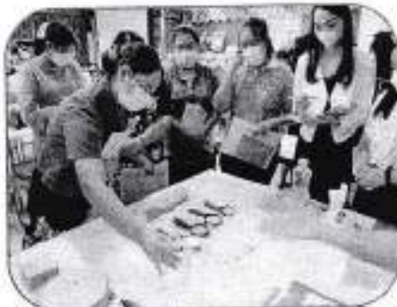
ภาพประกอบ

จากปัญหาที่พบ ได้ดำเนินการจัดส่งแนวทางการดำเนินงานในโครงการ ให้ครูผู้ที่ยังไม่ผ่านการอบรมขึ้นพื้นฐาน เพื่อศึกษา และสร้างความเข้าใจในเบื้องต้นเพื่อใช้ในการจัดกิจกรรม บ้านนักวิทยาศาสตร์น้อย ประเทศไทยได้อย่างมีประสิทธิภาพ